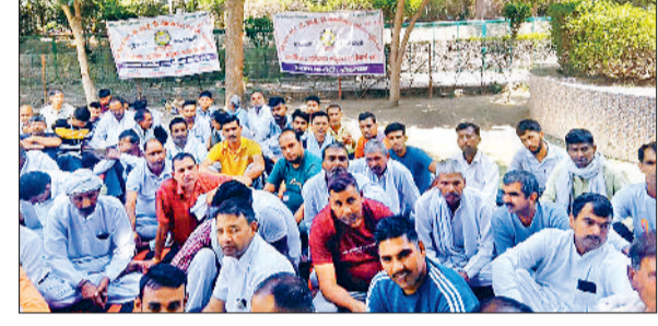
रोहतक। अपनी मांगों के लिए नारेबाजी करते हुए पीडब्ल्यूडी के कर्मचारी।