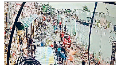
रोहतक। कलानौर के गांव बनियानी में भैंस नहलाने को लेकर हुए झगड़े की वारदात सीसीटीवी कैमरे में कैद हो गई।